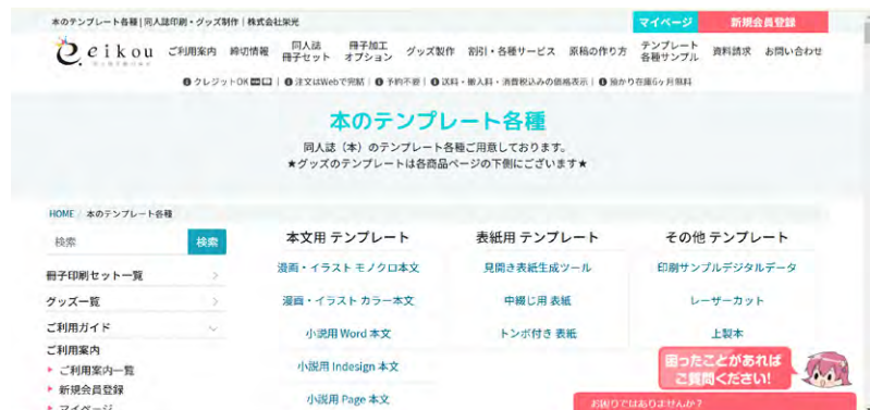
株式会社栄光さんのありがたいすぎる無料テンプレート