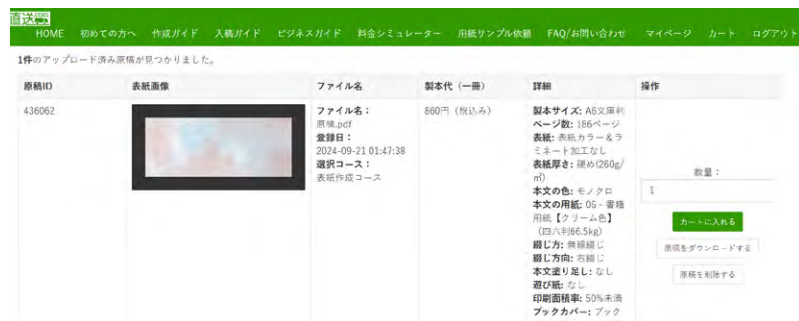
最終的なレイアウト